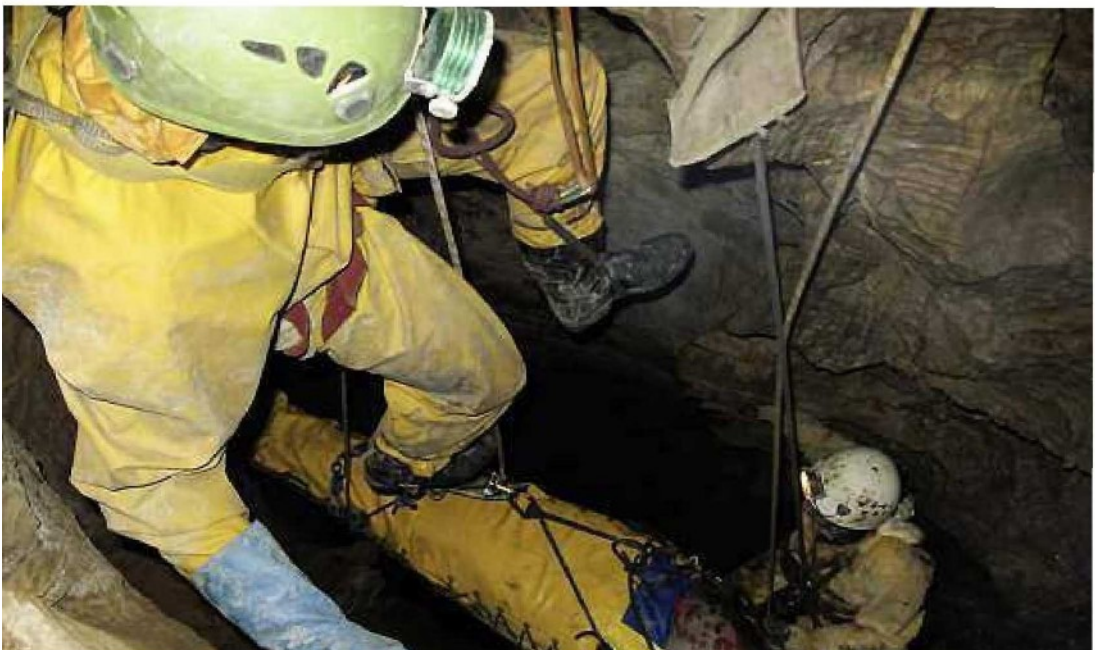
Rettungseinsätze stellen hohe Anforderungen an die Rettungsmannschaft und dauern zehn Mal länger als die normale Fortbewegung. Hier eine Szene einer Rettungsübung im Raum Beatenberg.