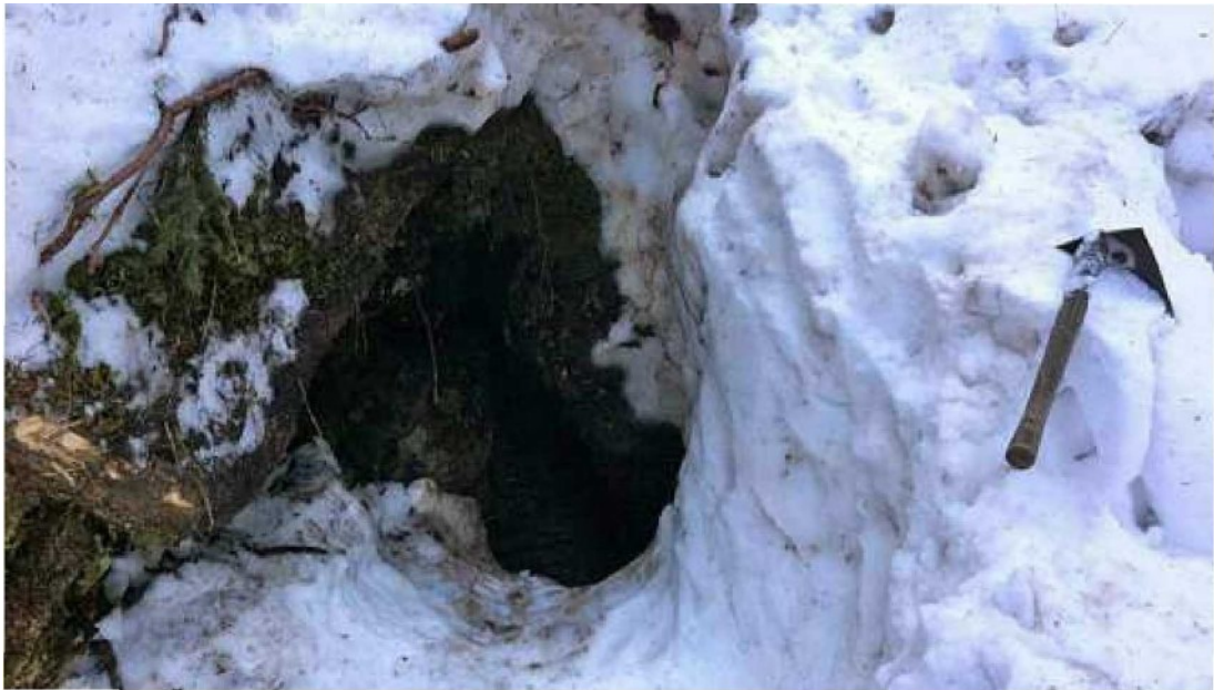
Der Eingang in die geheimnisvollen Tiefen: Hier beginnt die Höhle, in welcher die 30-jährige Frau ums Leben kam.